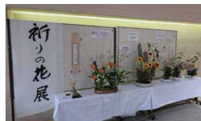
祈りの花展 多くの来場者が足を止め作品を鑑 賞していました。