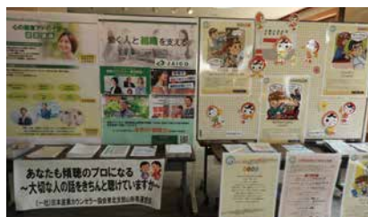
男女共同参画社会の実現に向けて沢山の団体が パネルを展示して啓発活動を行いました。