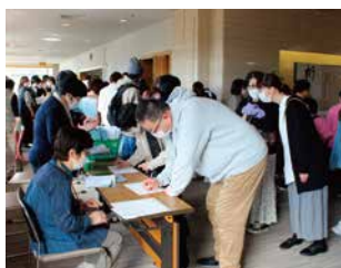
講演会 たくさんの方が来場され ました。