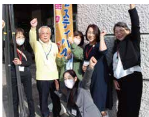
チェリア部長&実行委員のみなさん、 気合十分です!