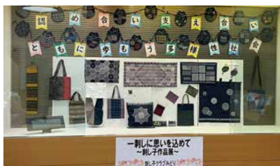
一本の線糸によって紡がれる美の世界