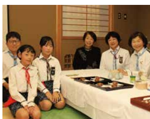
ガールスカウト山形県連盟のみな さん。おいしいお茶とお菓子が心が 和みます。