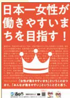
酒田시는2017年10月1日に「日本一女性が働きやすいまち」を目指す宣言をしました。

館長 共感力を発揮し市民とともに暮らしやすいまちを創り上げていくであろう姿が想像できます。とてもいいお話が聞けました。酒田のこれからに期待しています。ありがとうございます。