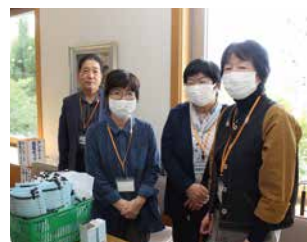
講演会・受付スタッフのみなさん