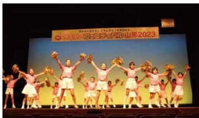
笑顔はじける、元気いっぱいのすてきなパフォーマンスでした。