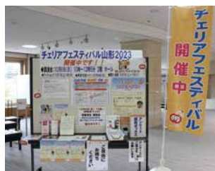
講演会はオンラインでも同時配信 されました。