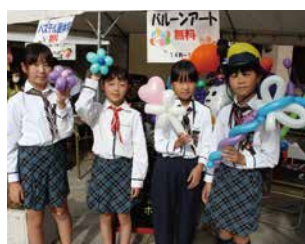
パルーンアートとパステル画体験。 どちらも子どもたちに大人気です た。