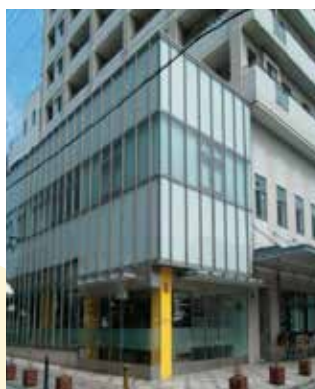
酒田市男女共同参画推進センター「Weiss」は酒田市の男女共同参画社会づくりを推進する施設です。